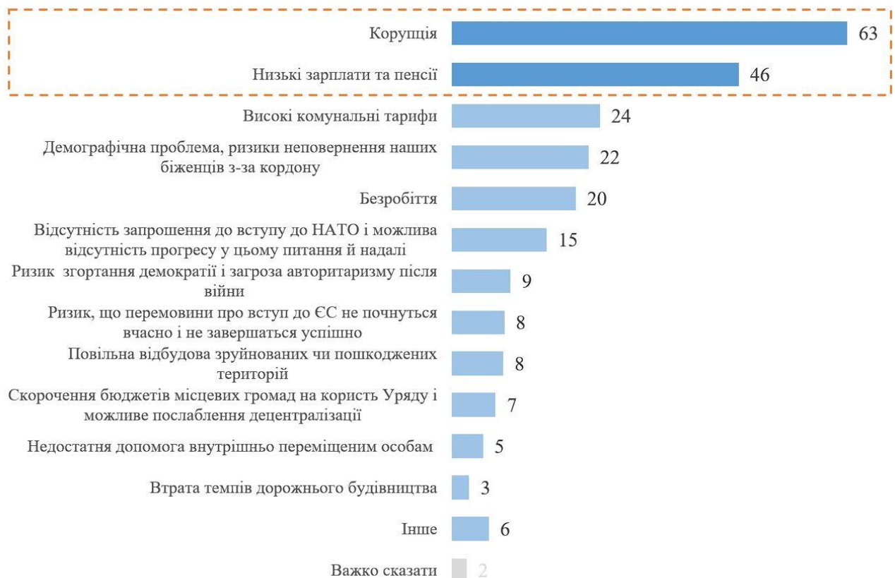
Рис 2. Які проблеми, крім війни, найбільше турбують українців (%)?[1]

Київський міжнародний інститут соціології (КМІС) з 30 вересня по 13 жовтня 2023 року провів всеукраїнське опитування громадської думки "Омнібус". До опитування було включено питання щодо найактуальніших проблем в Україні, окрім війни [1].