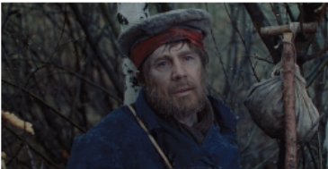
Смерть Платона Каратаєва